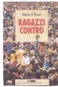
Ragazzi contro Ed. S.E.I. To – 1995 Saga familiare in 50 anni di vita italiana attraverso le vicende di tre quattordicenni.