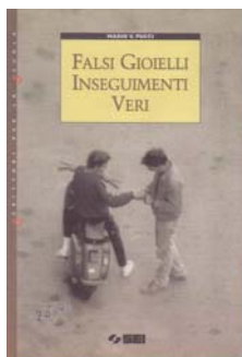
(1) Falsi gioielli inseguimenti veri Ed. S.E.I. TO. - 2000