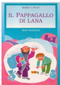
Il pappagallo di lana Ed. GIUNTI, FI – 1989 Fiabe moderne.