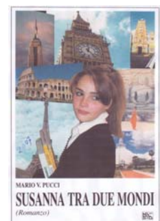
(3) Susanna tra due mondi Ed. Tip. MENNA, VT-2007

Avventura in tre tempi, come un arcobaleno, al di sopra delle distanze e delle tempeste, unisce l'occidente con l'oriente.