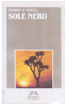
Sole Nero Ed. Mursia. MI-1991 Premio Bancarellino s.a. L'apartheid in Sudafrica.