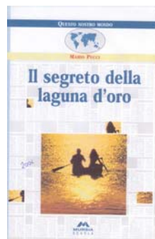
(2) Il segreto della laguna d'oro Ed. MURSIA, MI -2002