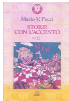
Storie con l'accento Ed. GIUNTI, FI. –1994 Fiabe moderne.