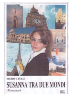
(3) Susanna tra due mondi Ed. Tip. MENNA, VT-2007

Avventura in tre tempi, come un arcobaleno, al di sopra delle distanze e delle tempeste, unisce l'occidente con l'oriente.